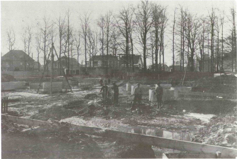
Leggen van de fundering van de oude kerk in 1924

U kunt erin lezen over het ontstaan van de parochie; de bouw van de kerk in 1925; de afbraak van parochie en kerk in de zeventiger jaren; de herleving van het kerkelijk leven in de laatste jaren en dat alles tegen de achtergrond van de maatschappelijke toestanden in onze gemeente.