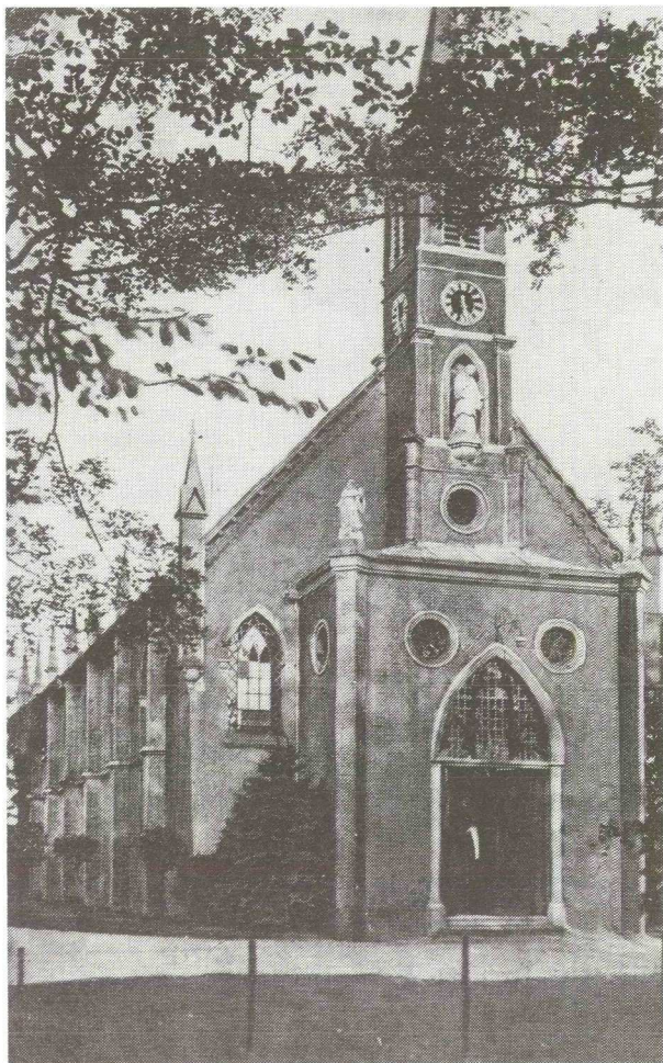
R.K. Kerk, Soesterberg

SOESTERBERG, R.K. stat. in het aartspr. van Utrecht. Men heeft er eene kerk in het geh. den Berg (zie dat woord), gesticht in 1839 en aan den H. Karel Bonnomeus toegewijd. Dit gebouw is in den Gothischen stijl met ijzeren ramen voorzien, heeft een zeer bevallig uiterlijk en maakt met de pastorie een geheel uit. De stat. wordt bediend door eenen Pastoor en telt ruim 400 zielen, onder welke ook eenige uit de burgel. gem. Zeyst mede gerekend worden. Het getal Kommunikanten, beloopt 230. De stat. van Soesterberg heeft ook eene afzonderlijke begraafplaats.