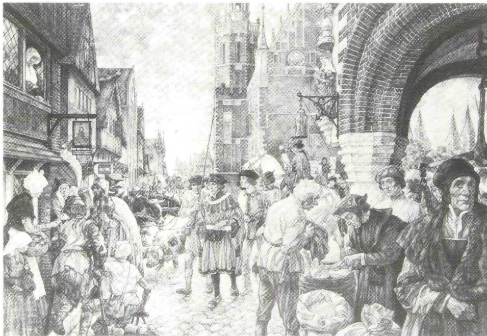
Een stad in de Middeleeuwen

"Hij kan geven wat hij ziet; plus zijn eigen liefde begrip en wezen".